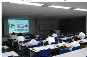
技術セミナーの風景