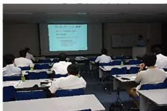
技術セミナーの風景